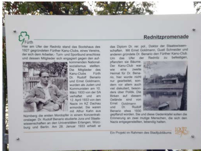
Die Gedenktafel an der Uferpromenade

Erst am 12. April 1983, dem 50. Jahrestag der Ermordung, erschien in den Fürther Nachrichten unter dem Titel „Da hörten wir Gewehrschüsse“ 5 eine erste große öffentliche Würdigung Rudolf Benarios und Ernst Goldmanns in der Stadt Fürth.